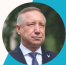
Губернатор Санкт-Петербурга Александр Беглов

— Мы продолжаем повышать уровень поддержки петербургских семей с детьми. Однако, чтобы повысить рождаемость, необходим комплексный подход, включающий улучшение жилищных условий, доступность качественной медицины, возможность обучения и работы для женщин, развитие семейно-ориентированной инфраструктуры. Нам недостаточно только финансово поддерживать семьи. Нужно создавать условия, чтобы люди чувствовали себя уверенно, могли совмещать карьеру и семью.